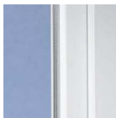
klasszikus design enyhén kerekített élekkel

A VEKA profilból készült korszerű műanyag nyílászárókkal minden ház csak nyerhet. A SOFTLINE rendszerek klasszikus vonalvezetése az enyhén lekerekített élekkel időálló és kitűnően harmonizál a legkülönbözőbb építészeti stílusokkal – legyen modern vagy hagyományos, új ház vagy felújítandó épület.