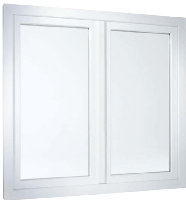
Kétszárnyú ablak eltolt síkú változatban

Meggyőző a technika is, ami a belsőt illeti: A többkamrás profil a levegő szigetelési tulajdonságát hasznosítja, melylyel a hőszigeteléssel szemben támasztott legmagasabb előírásoknak is megfelel. Ezzel nemcsak az egész évi kellemes közérzetet biztosítja, hanem hatására télen érezhetően csökken a fűtési költség is.